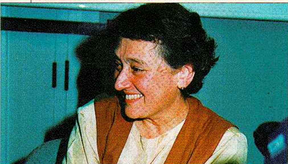
Lynn Margulis.

La Dra. Lynn Margulis (Dept. Geociencias, Un. Massachusetts, Amherst) ha dedicado su vida a investigar la teoría sobre el origen simbiótico de la célula eucariótica, pese a que sus ideas encontrarán grandes barreras en la comunidad científica en un principio. La simbiogénesis que postula la Dra. Margulis se basa en la incorporación y fusión del cuerpo celular por simbiosis, en un fenómeno que transcurrió muy probablemente en la Tierra primitiva. Su conferencia versó sobre el papel de la simbiosis en el proceso evolutivo. En los años 70 Margulis inició un estudio sistemático de las estructuras celulares que se encuentran en los eucariotas (animales, plantas, hongos y otros organismos colectivamente llamados protocistas) y propuso que orgánulos como la mitocondria (la central energética de las células cuando respiran oxígeno) y el cloroplasto (lugar donde se producen los fenómenos bioquímicos asociados a la