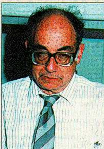
El Dr. Stanley Miller

S.M.: Sin duda pienso que ha habido aportación la pregunta a responder en el futuro es sobre la cantidad y la forma en que esta materia ha llegado a la Tierra primitiva. De todos modos, pienso que no debe haber sido mayor de un 5%. Si hay que depender de un aporte extraterrestre la cantidad es claramente insuficiente.